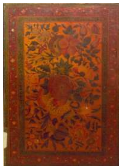
تصویر ۳. جلد رنگ و روغن با نقوش گل‌های الوان؛ نسخه شماره ۵۲۸۲ع کتابخانه ملی: قرآن کریم