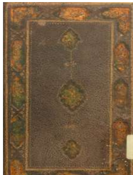
تصویر ۷. جلد ساغری مشکلی؛ نسخه شماره ۵۲۳۶/ع کتابخانه ملی؛ صحیفه سجادیه