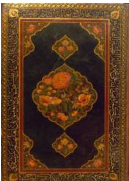
تصویر ۱-۲. جلد رنگ و روغن با طرح ترنج و سرترنج و لچکی؛ نسخه شماره ۱۹۷۶۷ کتابخانه ملی: زادالمعاد

در این بخش نمونه‌های مختلف و متنوعی از هرکدام از انواع جلدهای هنری به کار رفته در نسخ نفیس دوره قاجار (نسخه‌های مورد پژوهش) آورده شده است: