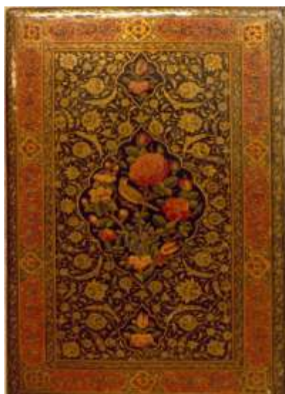
تصویر ۴. جلد رنگ و روغن با طرح ترنج و سرترنج و گل و مرغ؛ نسخه شماره ۱۲۳۶ کتابخانه ملی: منتخبی از شاهنامه