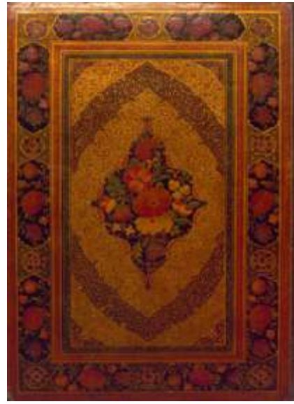
تصویر ۱-۴. جلد رنگ و روغن با طرح ترنج و سرترنج و نقوش گل و بوته‌های ریز و درشت و طرح‌های اسلیمی؛ نسخه شماره ۱۷۴۶۸ کتابخانه ملی: قرآن کریم