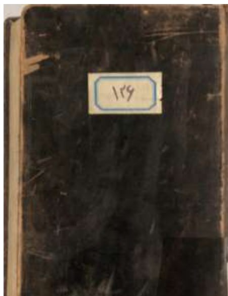
تصویر ۸. جلد میشن؛ نسخه شماره ۵۲۳۵/ع کتابخانه ملی؛ ترجمه زادالمعاد