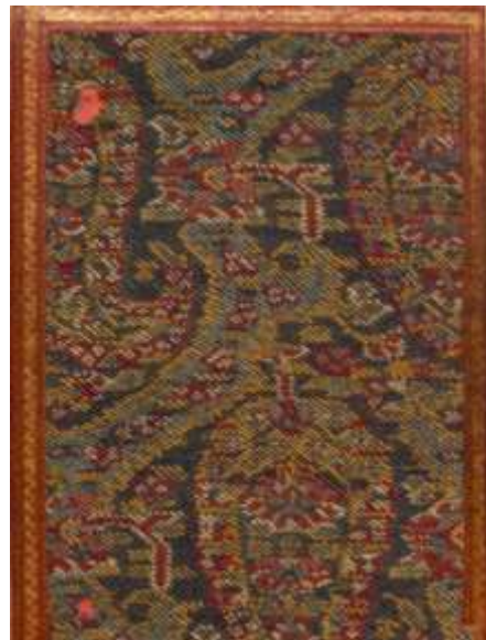
تصویر ۱۱. جلد ترمه‌ای پارچه‌ای؛ نسخه شماره ۶۰۱۶/ع کتابخانه ملی: قرآن