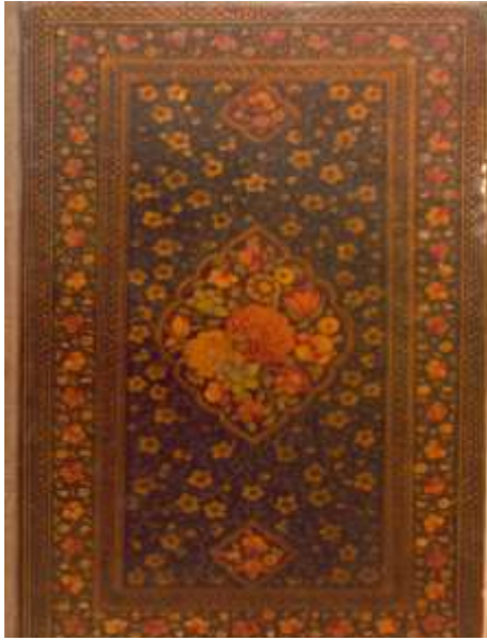
تصویر ۲-۴. جلد رنگ و روغن با طرح ترنج و سرترنج و گل‌های پیچک زرین و نقش ترنج و سرترنج با زمینه سنگرف و گل و بوته‌های الوان؛ جلد نسخه شماره ۲۸۲۴۸ کتابخانه ملی: حقیقه البیان فی شرافه الانسان