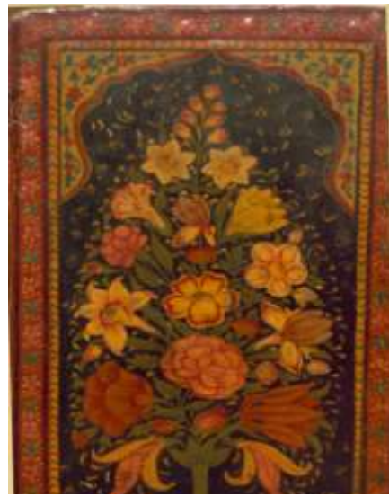
تصویر ۵. جلد رنگ و روغن با طرح شاخه گل بزرگ گلدانی؛ نسخه شماره ۵۰۶۵ع کتابخانه ملی: دیوان انوری