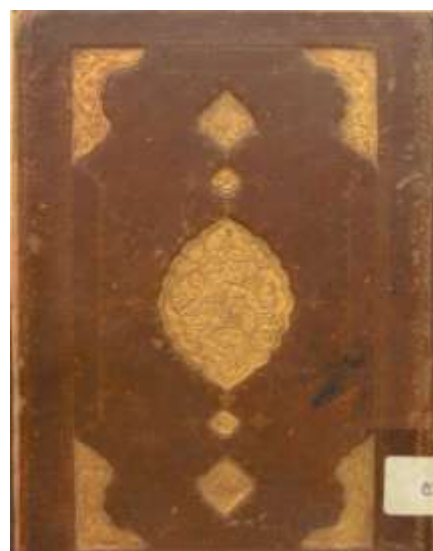
تصویر ۹. جلد تیماج قهوه‌ای و ترنج و سرترنج و لچکی‌ها با سوخت؛ نسخه شماره ۵۳۰۹/ع کتابخانه ملی؛ کتاب دعا