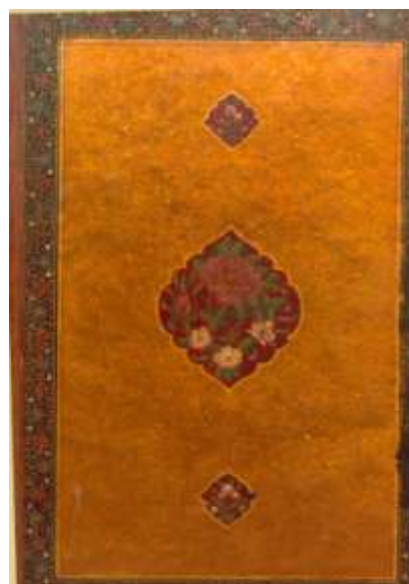
تصویر ۱-۱. جلد رنگ و روغن مرغش خردلی، با نقش ترنج و سرترنج با زمینه سنگرف و گل و بوته‌های الوان؛ نسخه شماره ۶۰۷۲ع کتابخانه ملی: قرآن کریم