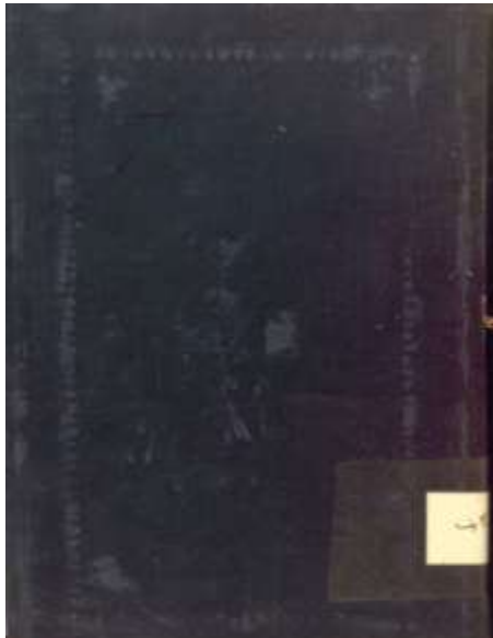
تصویر ۱۲. جلد مخملی سرمه‌ای؛ نسخه شماره ۴۰۶۷/ع کتابخانه ملی: گلستان