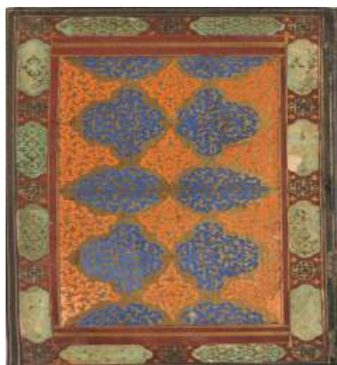
تصویر ۱۰. جلد مرقع، اندرون جلد نسخه شماره ۱۹۱۱۲ کتابخانه ملی؛ دیوان خاقانی